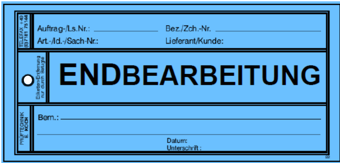
Qualitäts-Karton-Anhänge-Etikett Art.-Nr. 3.150/173