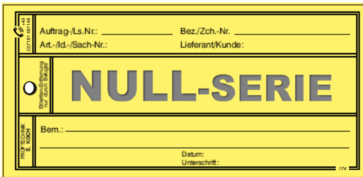
Qualitäts-Karton-Anhänge-Etikett Art.-Nr.: 3.150/174