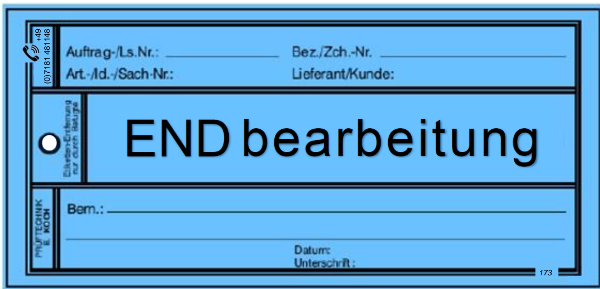
Qualitäts-Karton-Anhänge-Etikett Art.-Nr.: 3.150/173